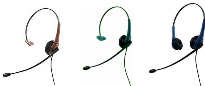
GN 2200 mono (crveni) GN 2200 mono (zeleni) GN 2200 duo (plavi)

S GN 2200 otkrit ćete vrhunac udobnosti pri telefoniranju. Zbog osjećaja da razgovarate oči u oči, čak možete zaboraviti da ste na telefonu. Pripremite se za povećanu učinkovitost i iskustvo ispunjeno bojom!